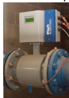
Contrôle de débit ▼