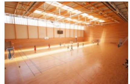
Salle de sport ▲