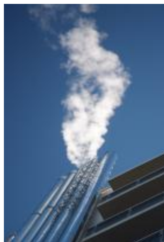
◀ Rejets des gaz de combustion