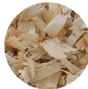
▲ Bois déchiqueté