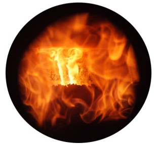
▲ Foyer chaudière