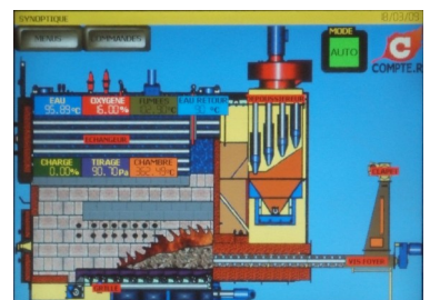
▲ Écran de contrôle chaudière

Soutien et développement de l'emploi local pour l'approvisionnement et la maintenance.