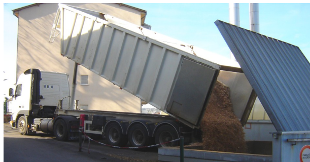
▲ Livraison de bois déchiqueté