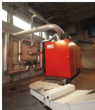
▲ Chaudière biomasse