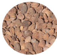
▲ Noyaux de fruits